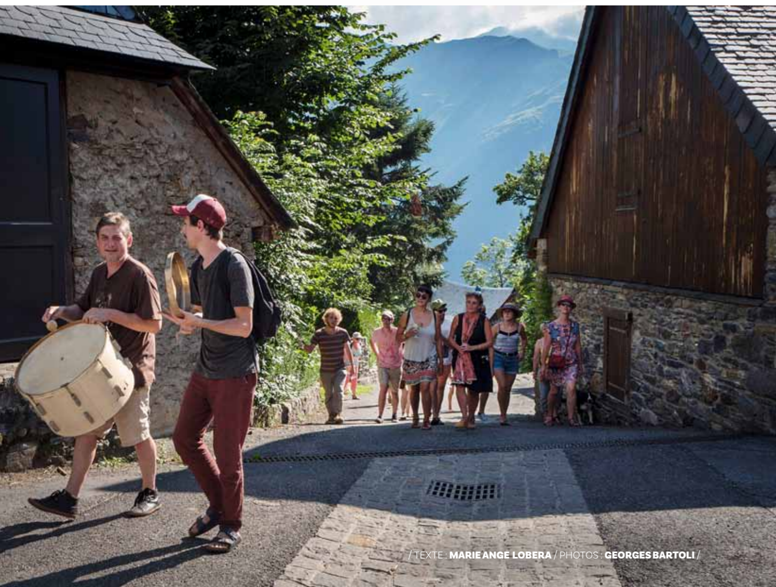
/ TEXTE : MARIE ANGE LOBERA /

Blotti dans la vallée de Louron, à 1300 m d'altitude, Germ est une véritable étape surprise. Un village qui cultive l'originalité, où randonneurs et artistes se rencontrent.